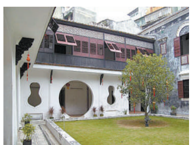
郑观应澳门故居一角

时代了。陈景润等一系列偶像身上那些被作为宣传亮点的要素,早已不是时人所爱。陈景润故居悄悄被拆除,连一点回音都没有泛起,在这些因素之外,多少让人感受到,科学家仍旧是这样一群略显寂寞的群体。