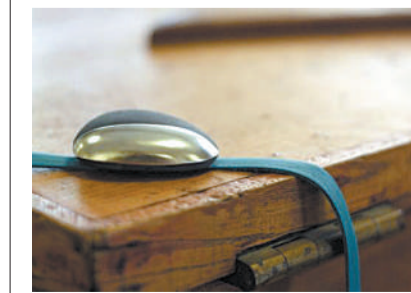
Magnet是一款外形像宝石的智能设备,它是通过触摸来让相隔两地的亲人在咫尺的亲近感。Magnet是成对出售的(起售价118美元)...

因其功能强大,UFO万能文件浏览器被微软公司指定为在XP、Vista和Win7平台的默认推荐软件,并将其投放到微软系统和官方网站,向全球用户推荐。