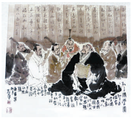
孔子讲学是中国画中的经典题材,今之“儒学工程”是否能得其真意?本图是一位当代画家的作品。

今天,对于现代文明话语下的儒学复兴,绝对不是简单地重新翻翻四书五经六艺,而是要以儒家思想之精华,凭借一些实在的,能够融入百姓生活的社会活动,重塑民间社会道德的自治能力。