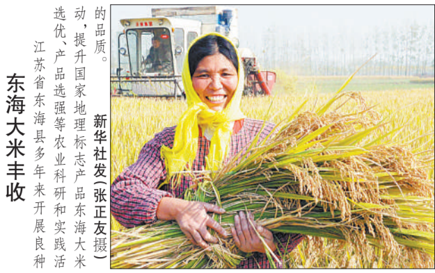
今年预计产量可达二点二万吨。近日,甘肃省临泽县十三点二万亩戈壁红果丰收。