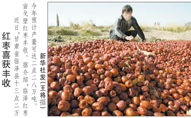
今年预计产量可达二点二万吨。近日,甘肃省临泽县十三点二万亩戈壁红果丰收。