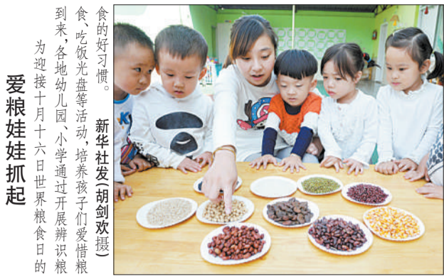
食的好习惯。