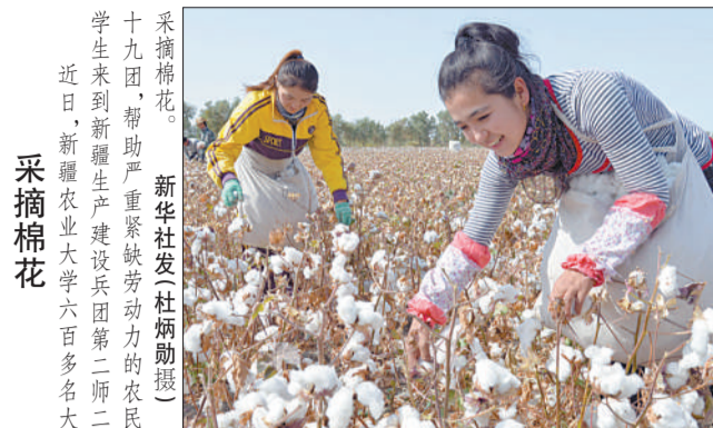
新华社发(杜师勇摄) 采摘棉花。新华社发(杜师勇摄) 十九团,帮助严重紧缺劳动力的农民,学生来到新疆生产建设兵团第二师二二二团,新疆农业大学六百多名大。