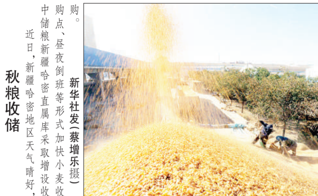
购点、昼夜倒班等形式加快小麦收获。近日,新疆哈密地区天气晴好,秋粮收获。