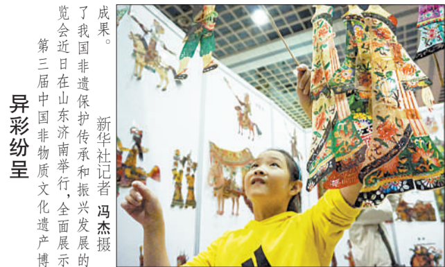
了我国非遗保护和振兴发展的成果。近日在山东济南举行,全面展示第三届中国非物质文化遗产博览。