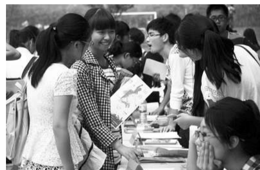
9月25日,浙江农林大学各类学生社团进行纳新活动,新生们纷纷到喜欢的社团咨询点前“相亲”,希望能加入自己喜欢的学生社团。