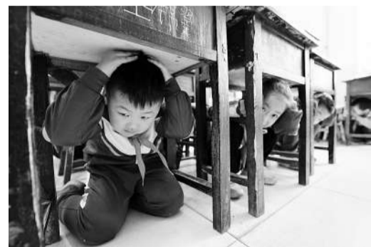
10月13日,河北省望都东关小学学生在进行地震灾害应急自救演练。 当日是第25个国际减灾日,河北省望都东关小学开展校园安全教育活动,组织学生进行灾害应急演练,向学生讲解消防、地震、安全防范等方面的常识,增强学生的应急避险与安全自救能力。