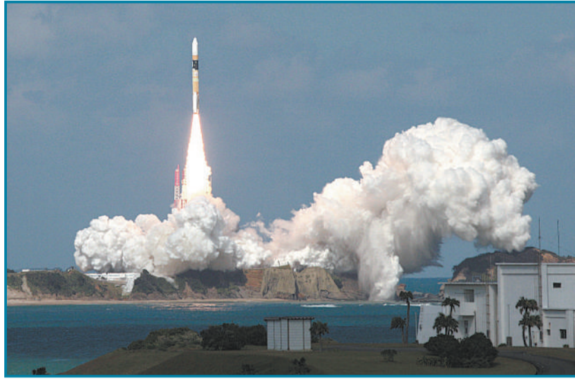
10月7日,日本鹿儿岛县种子岛宇宙中心,H2A火箭成功发射“向日葵8号”气象卫星。