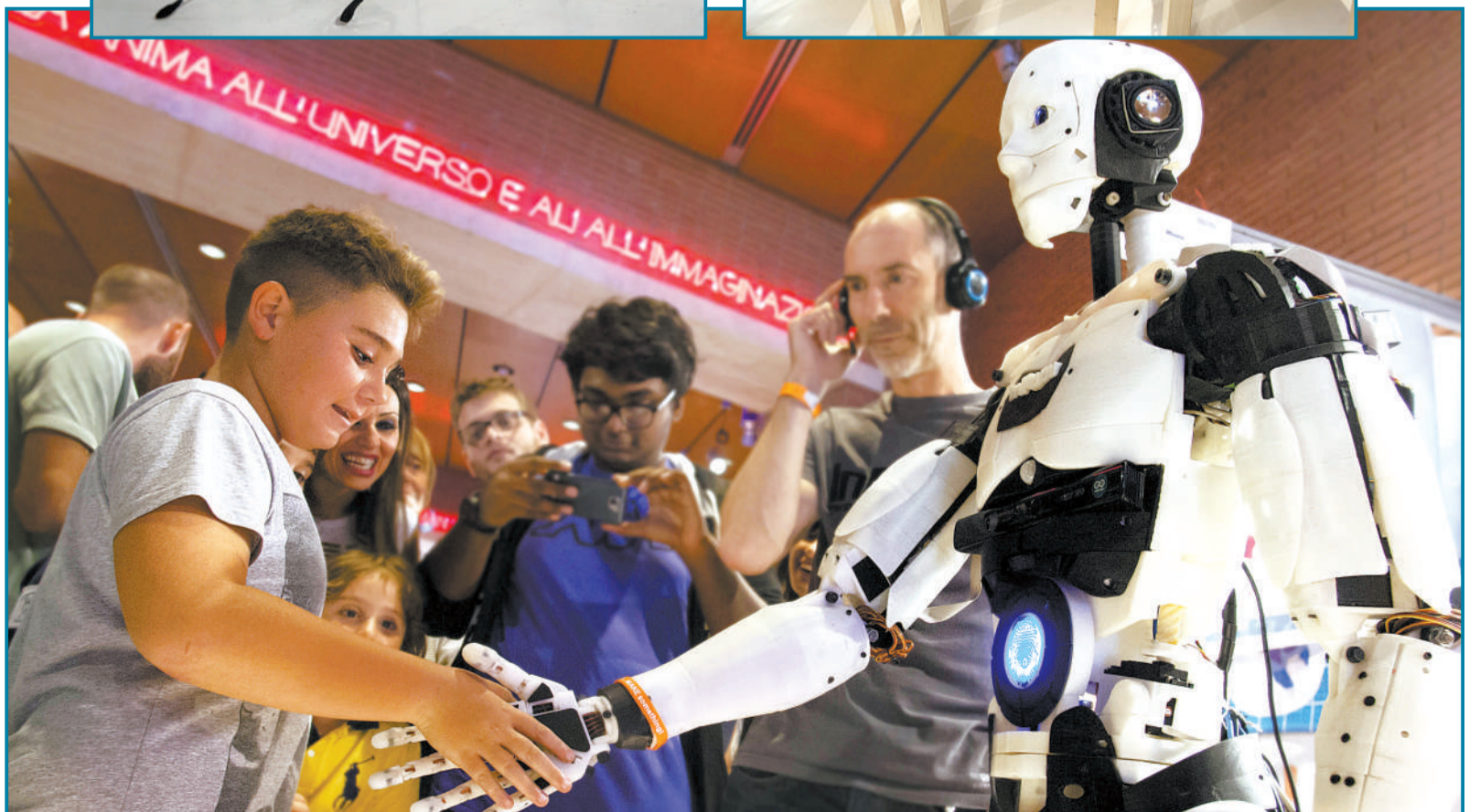
10月3日,意大利罗马,全球最大创意嘉年华Maker Faire在当地举行,该活动是世界上最著名的技术展览。