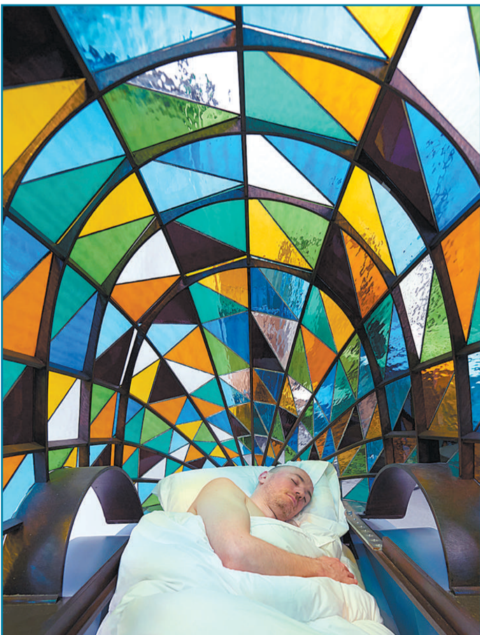
9月23日,英国汽车设计师多米尼克·威尔科克斯设计出一款车身由七彩玻璃所组成的无人驾驶汽车,汽车内部设有床铺。并且已经在伦敦街头展出。