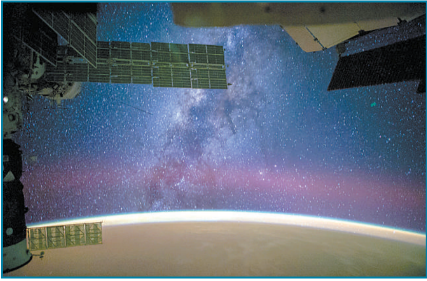
10月2日,美国宇航员里德·怀斯曼日前在国际空间站拍摄的银河。