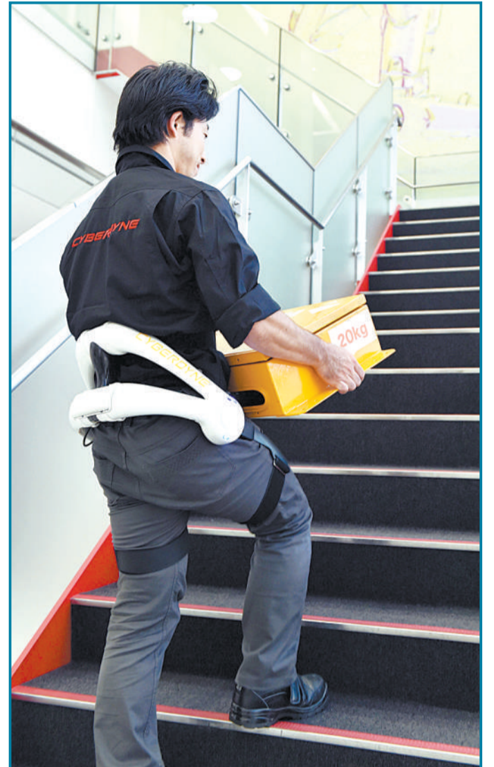
↑9月30日,日本东京近郊筑波,筑波大学的教授展示新发明的机器人套装“劳动者版HAL”。这个新发明可以模仿使用者的动作,把它穿在建筑工人身上,可以帮助工人节省力气。