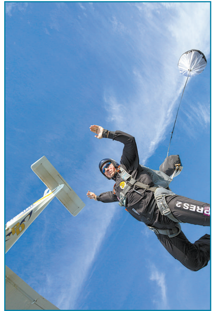
▲9月3日,美国印第安纳波利斯,58岁男子希望在24小时内跳伞700次打破世界纪录,他曾五次打破一天内跳伞次数最多世界纪录。他从2100英尺高处跳下,这一切都是为了慈善机构募款。