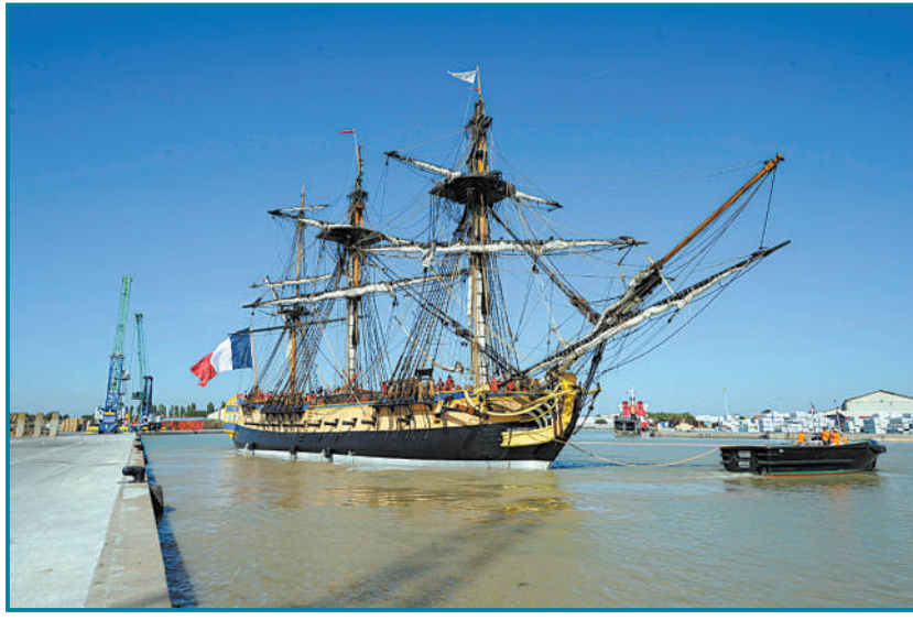
9月7日,历史名舰“赫敏号”舰船在法国西南部城市罗什福尔成功海试。当地为此举行了盛大的庆祝活动,来自全国各地数万人怀着激动的心情目睹了它的首航仪式。