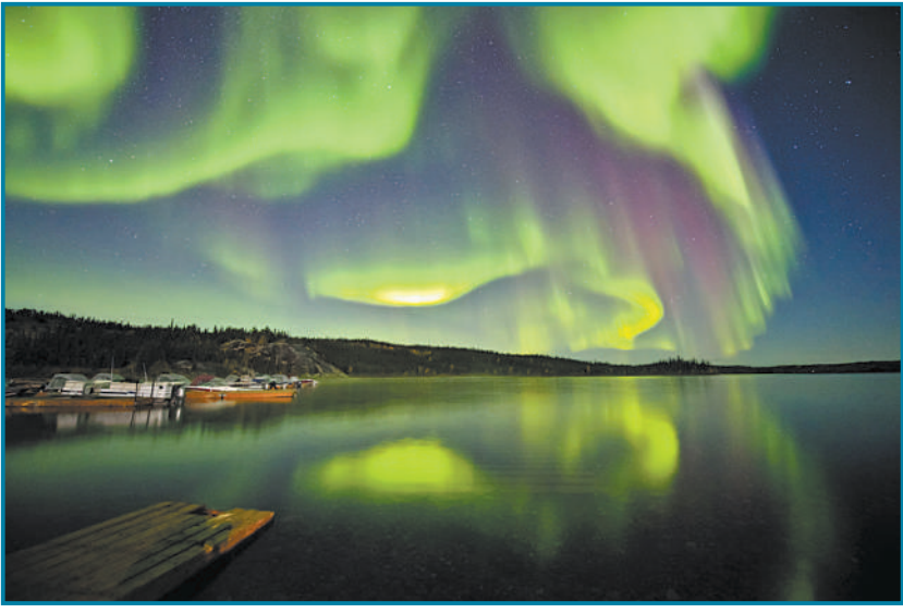
8月31日,加拿大耶洛奈夫,韩国摄影师Kwon O Chu拍摄绝美北极光景观。