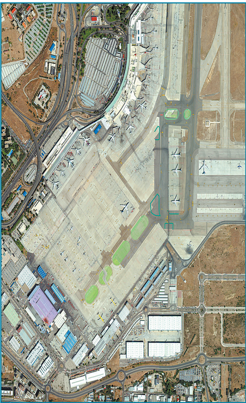
8月26日,西班牙马德里,DigitaGlobal发射的WorldView-3卫星拍摄的第一张图片。该卫星将在距离地球上空383英里(约616公里)的地方工作,其摄像头精度可达到50厘米以上,街上的井盖和邮箱都能看得一清二楚。