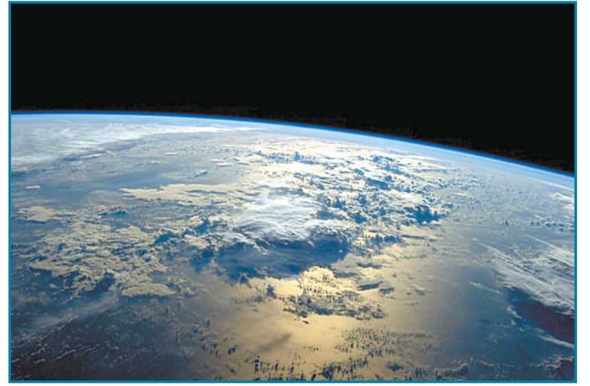
9月2日,美国宇航员Reid Wiseman发布了这张从国际空间站看到的景色图片。