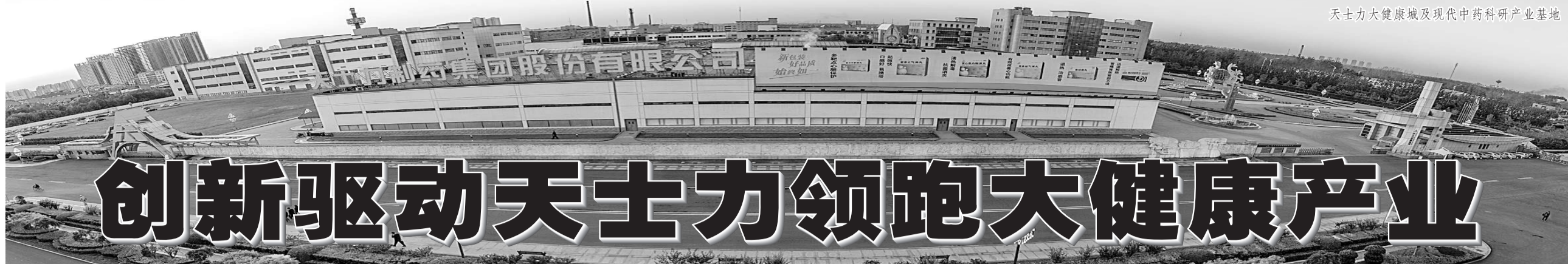
天士力大健康城及现代中药科研产业基地