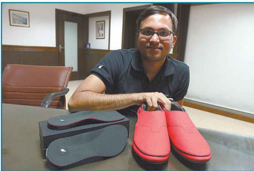
8月11日,印度海德拉巴,Ducere科技首席执行官克里斯潘·劳伦斯展示该公司推出的智能运动鞋。可以用蓝牙同步智能手机应用,通过鞋子振动向用户提示前进方向。