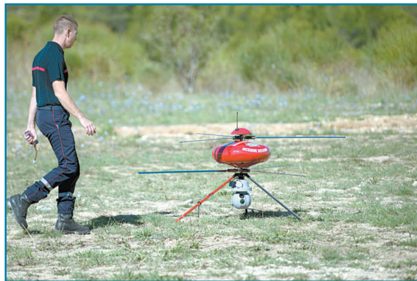
8月28日,法国莱斯佩尼斯米拉波消防队在救援中心展示无人机,它们将用于监视山火和洪水等自然灾害。