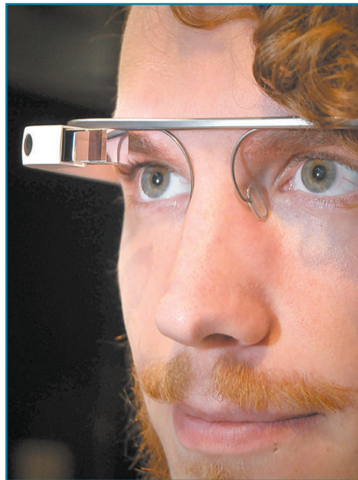
▲8月26日,瑞典斯德哥尔摩,在2014数字医疗会议上,医疗应用谷歌眼镜颇受关注,谷歌眼镜在医疗方面的应用通过为麻醉师提供实时数据辅助手术。