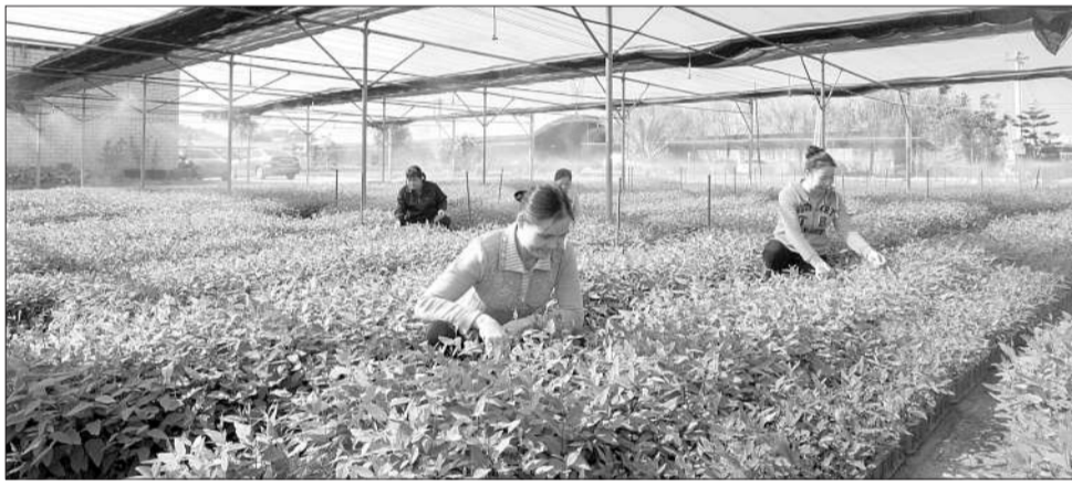
高峰林场林业研究中心苗圃