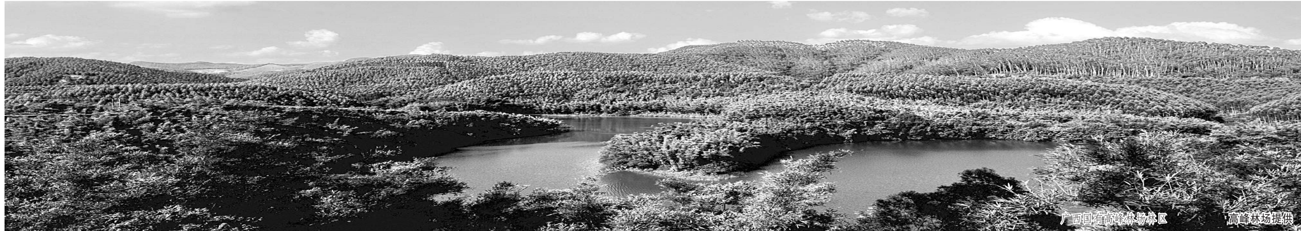
广西国有高峰林场林区

下一阶段,高峰林场将紧扣国有林场改革的总体要求,继续高举生态林业和民生林业两面大旗,进一步解放思想,转变发展观念,最大限度发挥林业的多种功能,使森林生态、林业产业、林业生态文化三个体系最优化和生态、经济、社会三个效益最大化,努力构建一个“森林优质高效、生态经济协调、资源持续经营、林场富裕和谐”的新高峰,争做国有林场改革发展的标兵,做大做强先行者,为“美丽广西”和“美丽中国”建设作出更大的贡献。