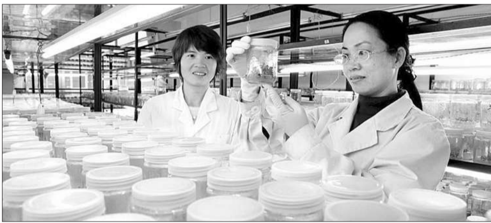
高峰林场林业研究中心组培厂