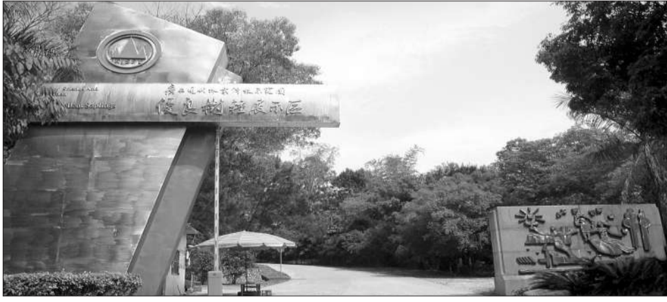
位于高峰林场果牌分场的广西林业科技示范园