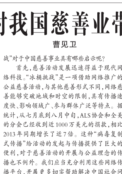
提升中国公益慈善活动的实效性影响力。首先,慈善活动发展迅速得益于现代网络技术。“冰桶挑战”是一项借助网络推广的公益慈善活动,与其他慈善形式不同,网络慈善能够突破地域和时空的限制,具有传播速度快、影响领域广、参与群体广泛等特点。