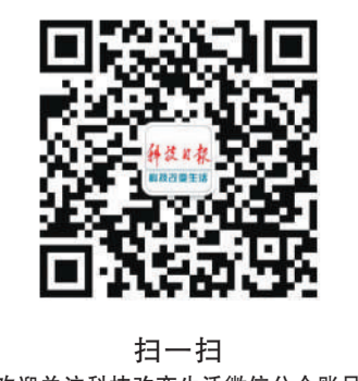
扫一扫 欢迎关注科技改变生活微信公众账号

“在家里,你突然感觉到肚子疼,一个电话,甚至是滑动一下iPad,就有专门的社区医生来问诊,打针也可以在家里操作。如果社区医生解决不了,还会给你安排专家进行远程会诊……”这一切,在美克置地打造的嘉美湾示范项目中,已然成为现实。