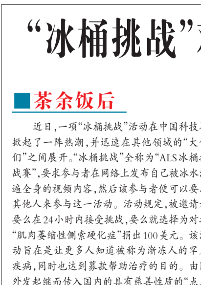
“冰桶挑战”对我国慈善业带来哪些启示? 曹见卫