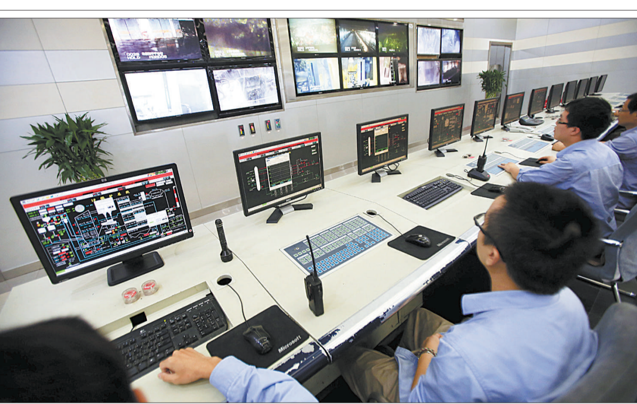
画中有话 近年来,我国城市垃圾问题日益突出,随意堆放的垃圾严重污染了大气、水和土壤,成为城市发展的“毒瘤”。图为工作人员在宁波中科茂(慈溪)环保热电有限公司的主集控室通过显示屏监控垃圾焚烧锅炉的工作状况。

理研究中心副主任尚重生认为,“对于明确禁用的,就应该禁止销售。如果有些非食品领域需要使用这些添加剂,必须严格限定使用范围。”