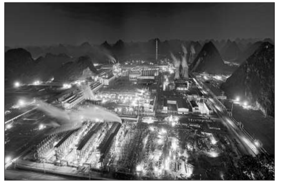
百色市积极推进生态铝产业示范基地建设，铝工业已经发展成为全市第一大支柱产业。图为蒸蒸日上的全国生态铝产业示范基地重要组成之一——靖西信发铝。