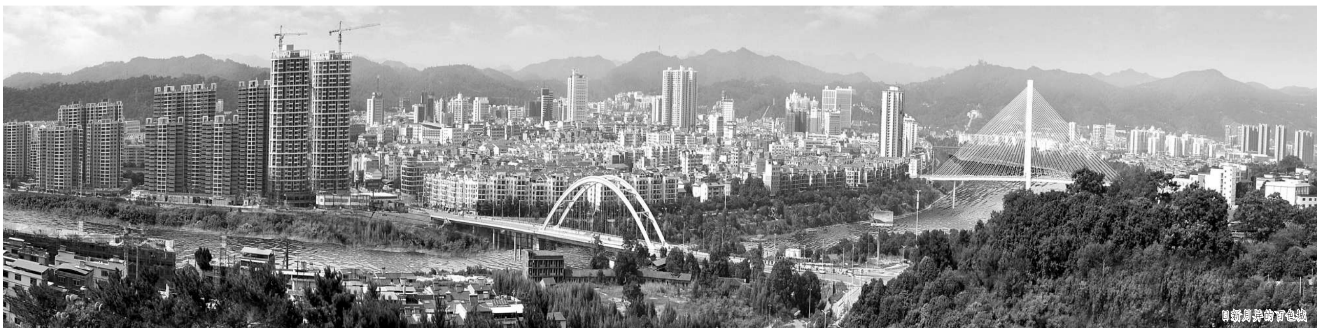
日新月异的百色城