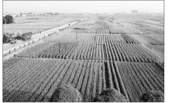
作为全国重要的“南菜北运”基地，百色大力发展蔬菜种植。图为“南菜北运”基地的核心区：田阳万亩蔬菜生产基地。