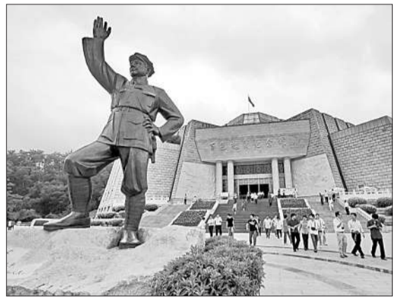
在邓小平同志诞辰110周年即将到来之际，百色红色旅游日益火爆，到百色起义纪念馆游玩的人络绎不绝。

千姿百色美，万象红城新。在邓小平同志诞辰110周年之际，百色400万各族人民正秉承百色起义精神，推动百色跨越追赶发展。