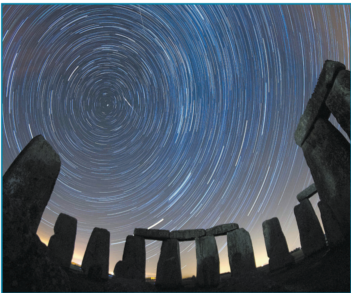
▲8月13日,英仙座流星雨来袭,而在英国神秘的巨石阵观赏流星雨,更是别有一番情趣。