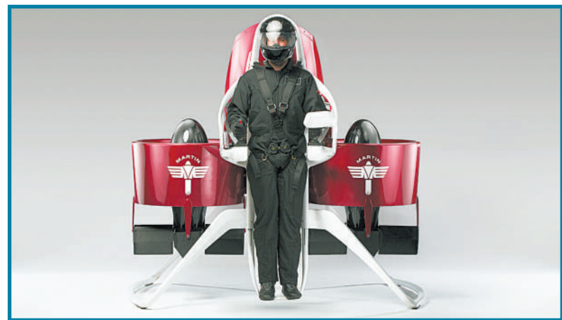
▼新西兰马丁飞机有限公司发布的最新款人性化疯狂喷气机。该公司开发人员表示新西兰航天部门已经批准了这类喷气机,允许其进行人工测试。