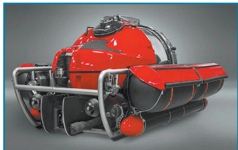
▲全球最先进的海底豪华轿车能够同时容纳5人,配备了空调,能够在1000英尺水下行驶,360度的透明压力壳能够让你在水下有着非常优秀的视野。