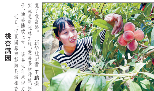
实施了新造林工程... 近日,宁夏固原市彭阳县温棚杏