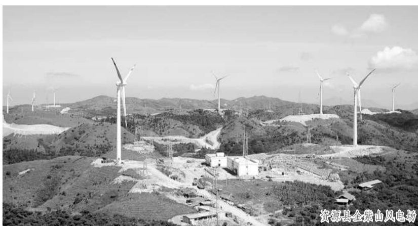
资源县金紫山风电场