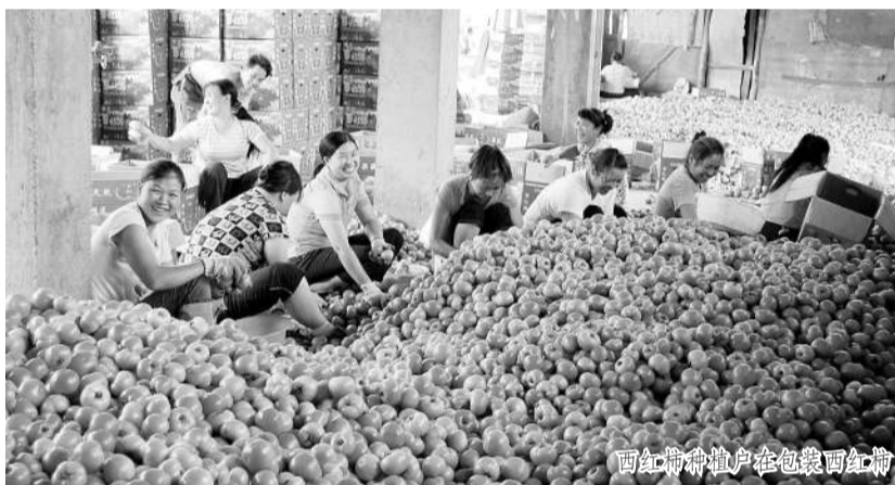
西红猕猴桃农户在包装红猕猴桃