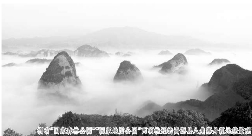
拥有“国家森林公园”“国家地质公园”两项桂冠的资源县八角寨丹霞地貌景观

部农业总产值的60%以上。 在特色农业的发展思路指导下，资源县农业迅速实现从“小作坊”到“大产业”，从“单打独斗”到“集团作战”转变，并向规模化、特色化、生态化、科学化的现代农业方向大步迈进，不断实现转型升级。 “资源县将进一步做大做强特色农业这篇文章，到‘十二五’末，使全县红提面积达到8万亩、西红柿面积达到3万亩、金银花面积达到10万亩、红阳猕猴桃面积达到4万亩……把资源县打造成为特色农业强县。”资源县委书记文飞说。 如今，资源县，特色农业的道路越走越宽阔，农民的生活也越来越富足。