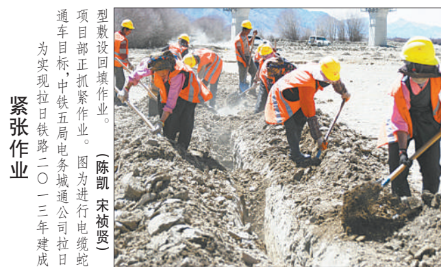
图为检修人员在变电站进行检修。(张振民)