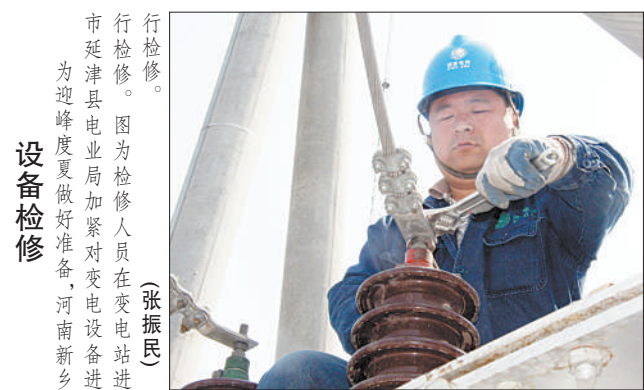
图为检修人员在变电站进行检修。(张振民)