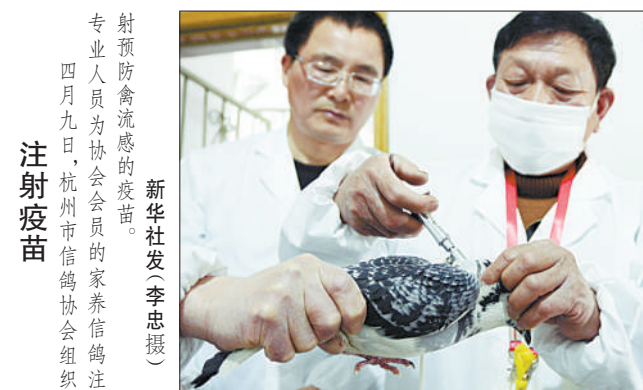
射预防禽流感的疫苗。